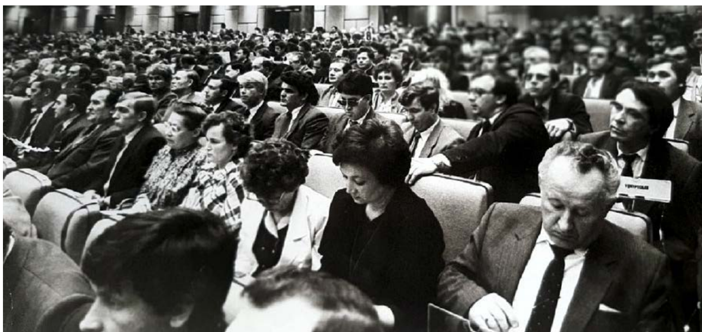
Делегация Удмуртской АССР на заседании XXVIII съезда Коммунистической партии СССР.