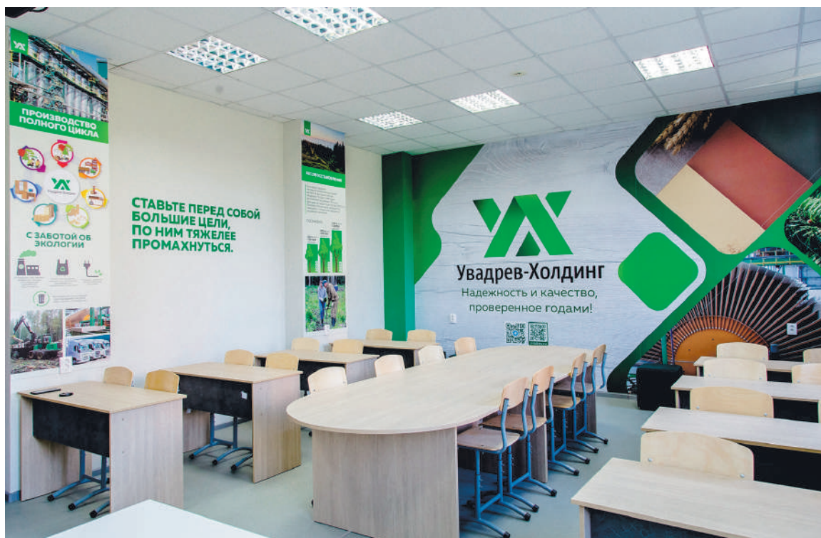
Учебная аудитория УдГАУ оборудована на средства предприятия.

Молодые люди, получившие специальность, смогут найти работу на ООО «Увадрев - Холдинг» с достойной заработной платой, благоприятными условиями труда и перспективами развития в профессии.